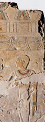
Ancien relief représentant la procession d'un roi (détail) Calcaire peint, 101 cm Moyen Empire, 18 e dynastie, règne de Montouhotep Méchyperré, 33 e siècle avant J.-C. Traversano, Italie, Palais d'Edouard Naville à Des et Sofian Donnée par l'Association France, 1900 Genève, Musée d'art et d'histoire, inv. 4357

Sur les pas de ces Genevois, grâce aux objets et aux documents qu'ils ont rapportés, aux visions qu'ils ont transmises de leurs aventures – témoignages empruntés, dans leur grande majorité, à des collectionneurs genevois –, c'est toute l'histoire d'une fascination pour l'Égypte, accrue par les acquis de la recherche moderne, que l'exposition se propose d'évoquer.