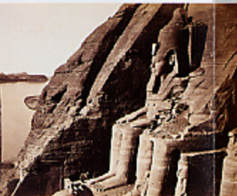
Henri Richard (actif entre 1802 et la fin des années 1830) Scènes de l'Égypte à au temple d'Osiris de Thèbes, s.d. Nigatif sur verre au collodion, éprouve sur papier albuminé, 26 x 37 cm Genève, collection particulière